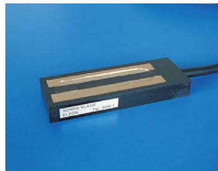
Sonda za vlagu SOV - 1