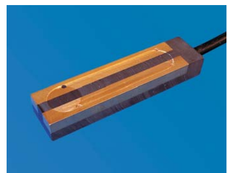
ETOR - 55