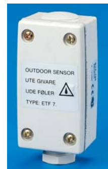
ETF - 744/99

ETO - 1550 je elektronički regulator za vođenje otapanja snijega i leda koji može raditi kao obični termoregulator (kada je preklopnik "MOIST CONTROL" u položaju "OFF") ili kao pravi regulator, vođen mjerenjem temperature i vlage (kada je preklopnik "MOIST CONTROL" u položaju "ON"). Položaj "ON" omogućuje uštedu energije i do 50%. Zbog toga ga treba gotovo uvijek koristiti!