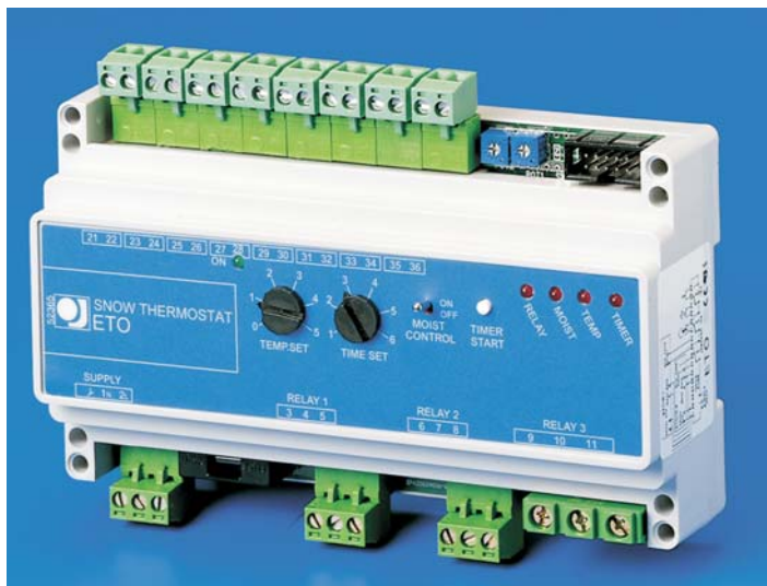
ETO - 1550